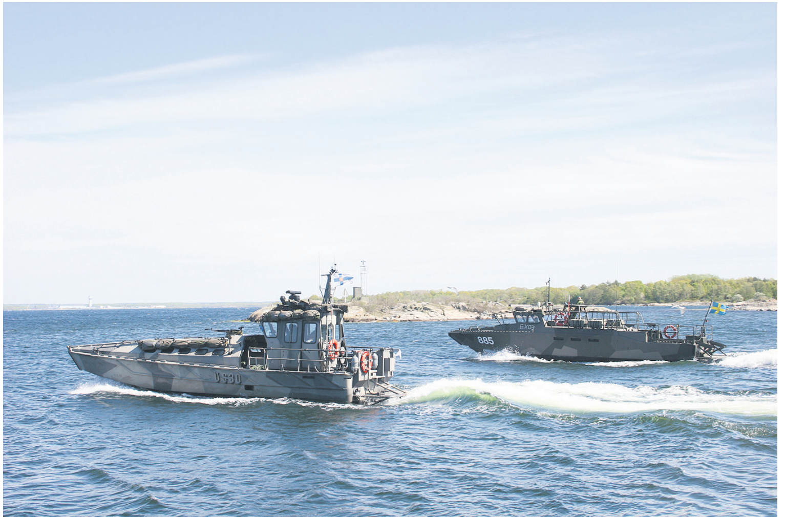
Kohta myös Lohtajan rannoilla sotaharjoitellaan.

Toimikunnan tehtävä pohjautui vuoden 2004 valtioneuvoston selontekoon, jossa todetaan, että harjoitusalueiden kehittämisessä on otettava huomioon mahdollisuudet eurooppalaiseen yh-