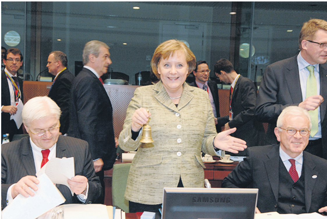
EU eliitti herättelee perustuslakia henkiin.

Mitä sitten suunnitellaan? Ei esimerkiksi asiakirjan tuomista avoimeen kansalaiskeskusteluun sillä tarkoitus ei ole "sotkea" kansalaisia millään tavalla kokoprosessiin. Päinvastoin! Saksan suunnitelmiin kuuluu karsia esityksestä pois kaikki sellainen tavara, joka mahdollisesti vaarantaisi uudelleen sen läpimenon. Saksan liittokansleri Angela Merkel on lähettänyt jäsenmaiden hallituksille 12 kysymystä, joihin on pitänyt vastata 4.5. mennessä. Mitähän meidän hallituksemme on Merkelille vastannut? Kysymykset ovat sinällään varsin paljastavia.